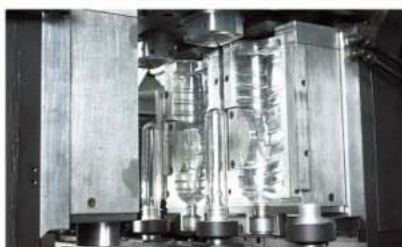
把手前植入系統 Handle Pre-insert Robot