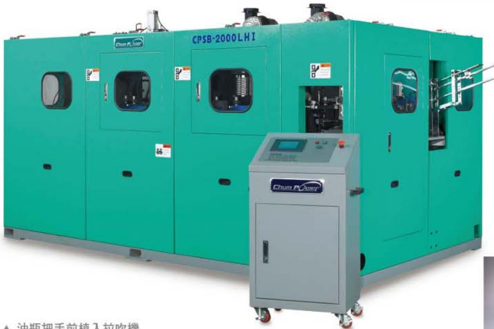
▲ 油瓶把手前植入拉吹機 PET Stretch Blow Molding Machine With Handle Pre-Insert