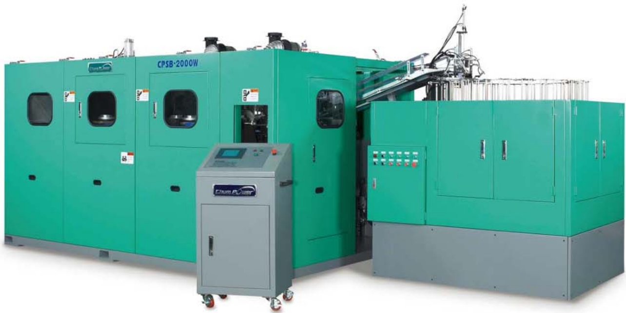
▲ 廣口瓶拉吹機 PET Wide-Neck Jar Blow Molding Machine