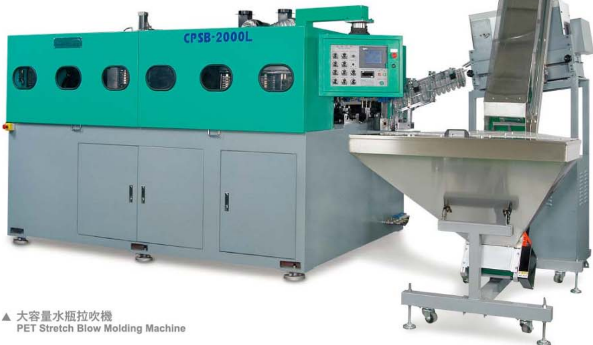
▲ 大容量水瓶拉吹機 PET Stretch Blow Molding Machine