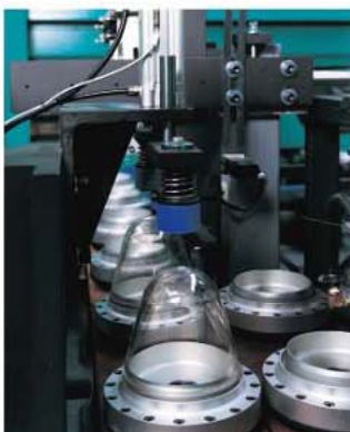
◀ 入胚系統 Feeding System

Oval, Off center, Petaloid, Square, Flat, Round bottles, Jars and Wide mouth containers……etc.